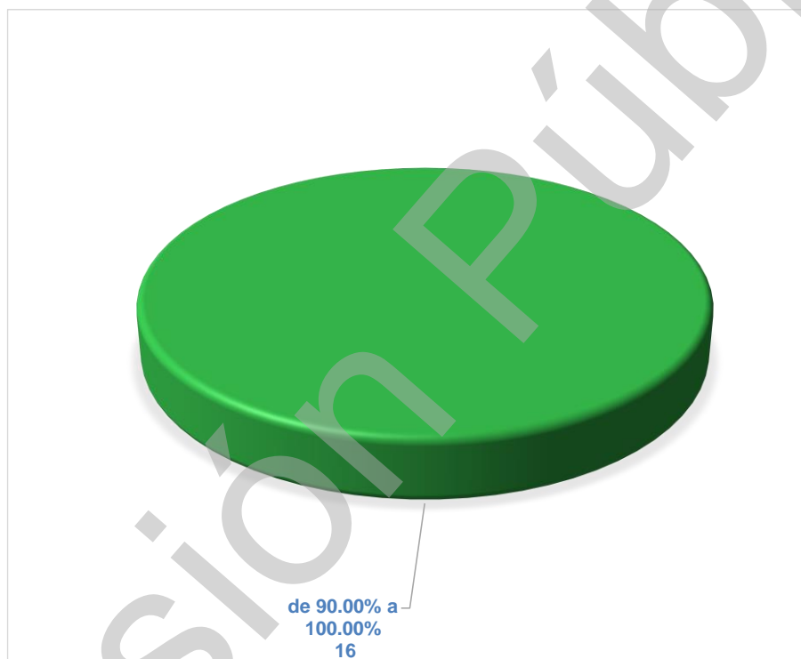
Gráfica 2 Cumplimiento de Actividades de Componentes por Programas Presupuestarios 2021 (Porcentajes)